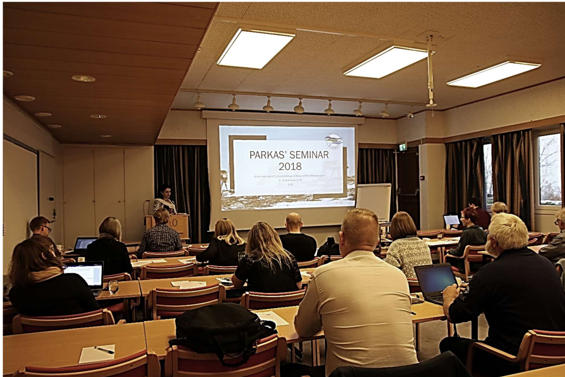
Figur 1 - Seminaret er i full gang (bilde fra andre dag, boldt på engelsk)

Bakgrunn for høstseminaret (6.-8. november 2018, Geilo) er FoU-prosjektet «Building trust to environmental policy as catalyst for a green transition - PARKAS» (forskerprosjekt-MILJØFORSK 2018-2021).